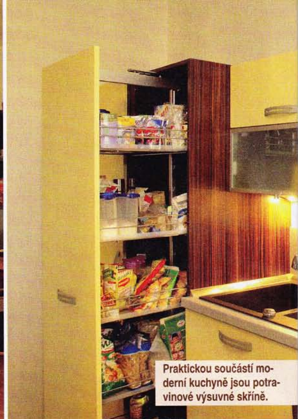
Praktickou součástí moderní kuchyně jsou potravinové výsuvné skříně.